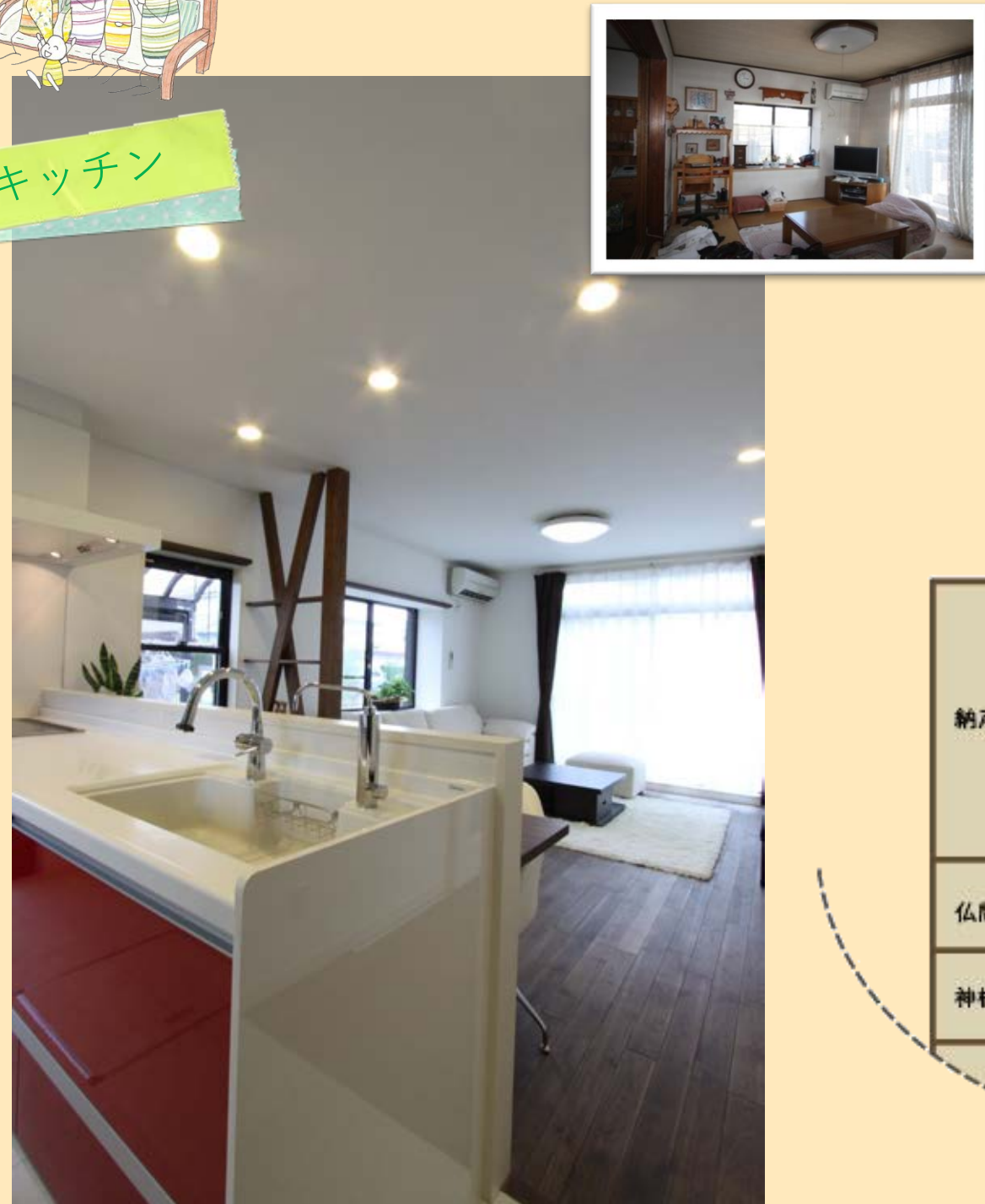
キッチンからリビング。奥さま念願の対面キッチン。