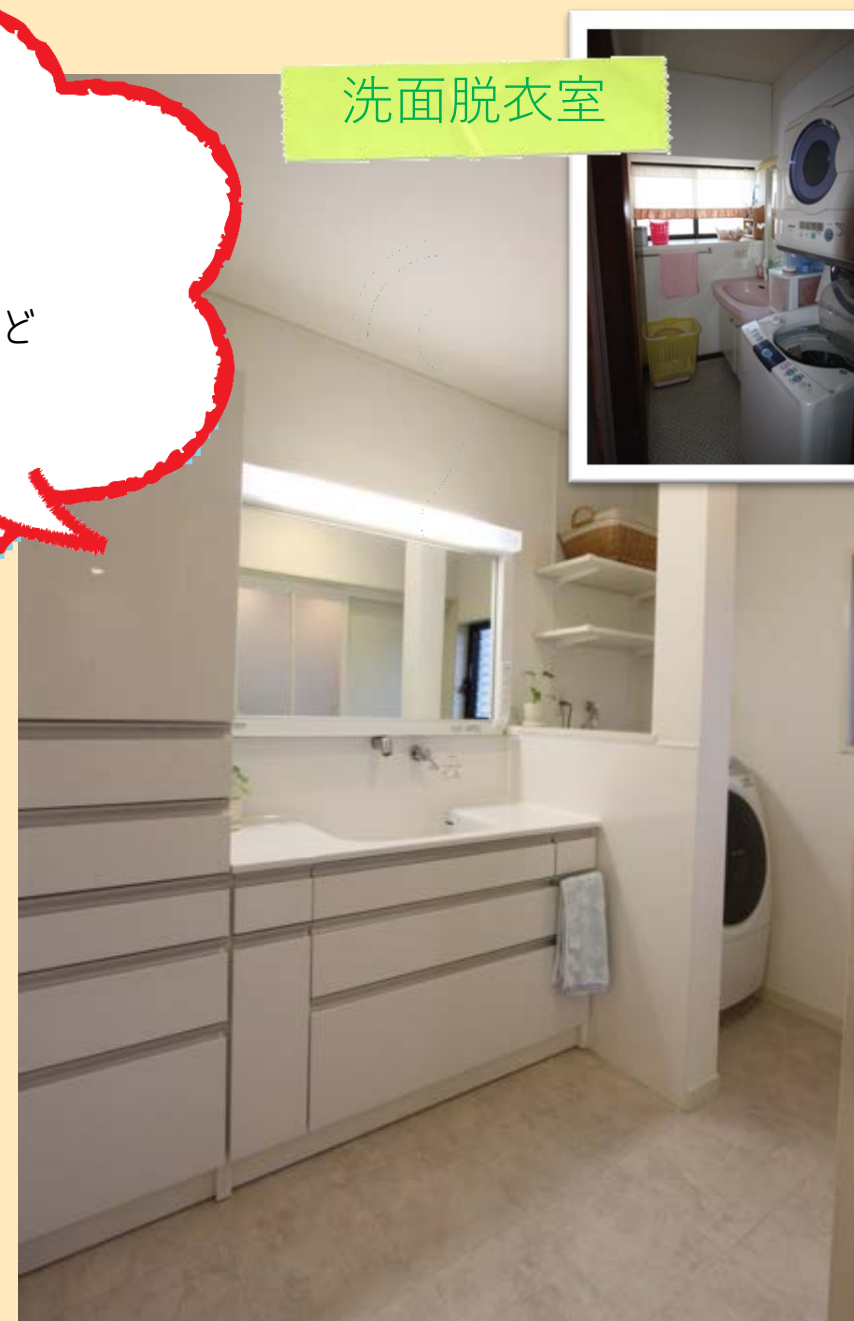
白で統一され、清潔感いっぱい！