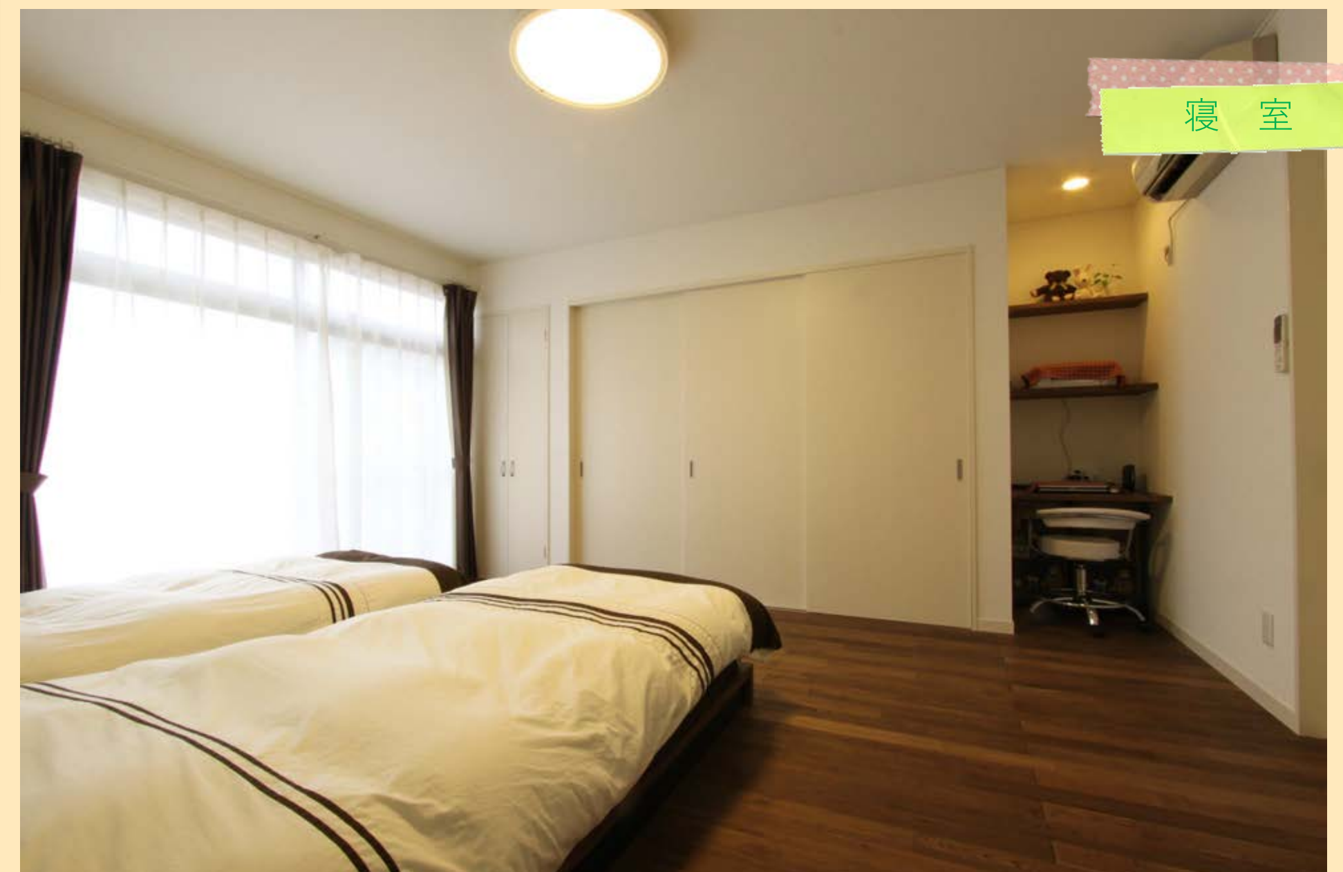
1階の和室だった部屋をご夫婦の寝室に。大容量のクローゼットとPCスペースもできました。