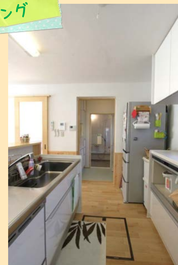
洗面の位置を入れ替え、LDKから出入りできるように間取り変更。