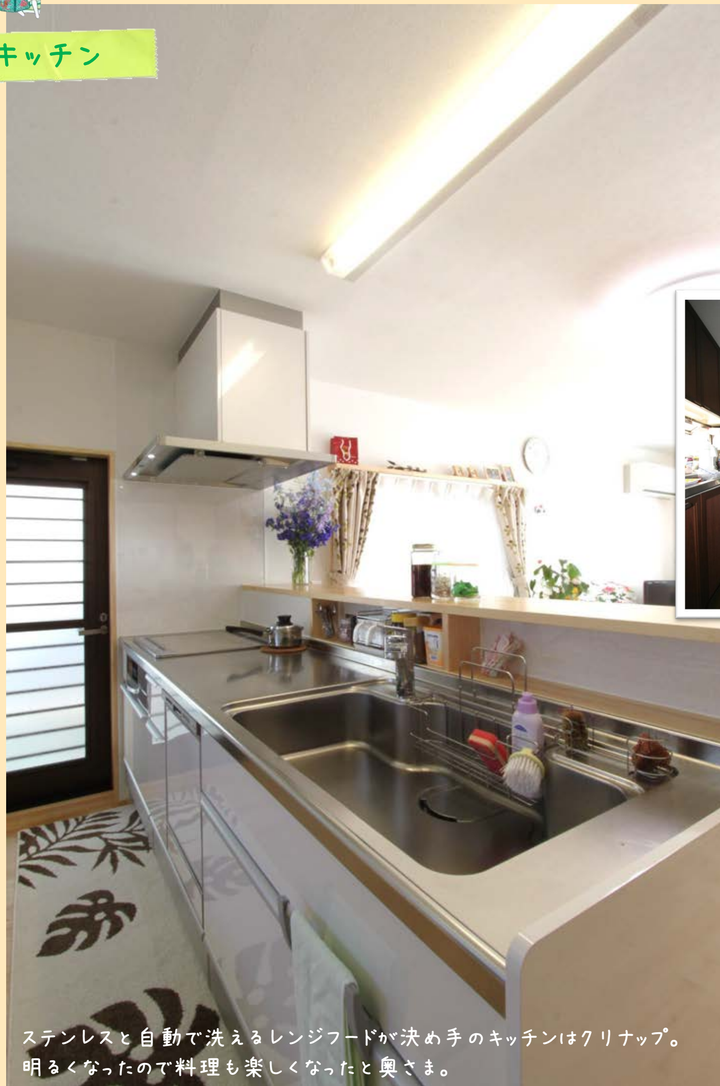
ステンレスと自動で洗えるレンジフードが決め手のキッチンはクリナップ。明るくなったので料理も楽しかったと奥さま。