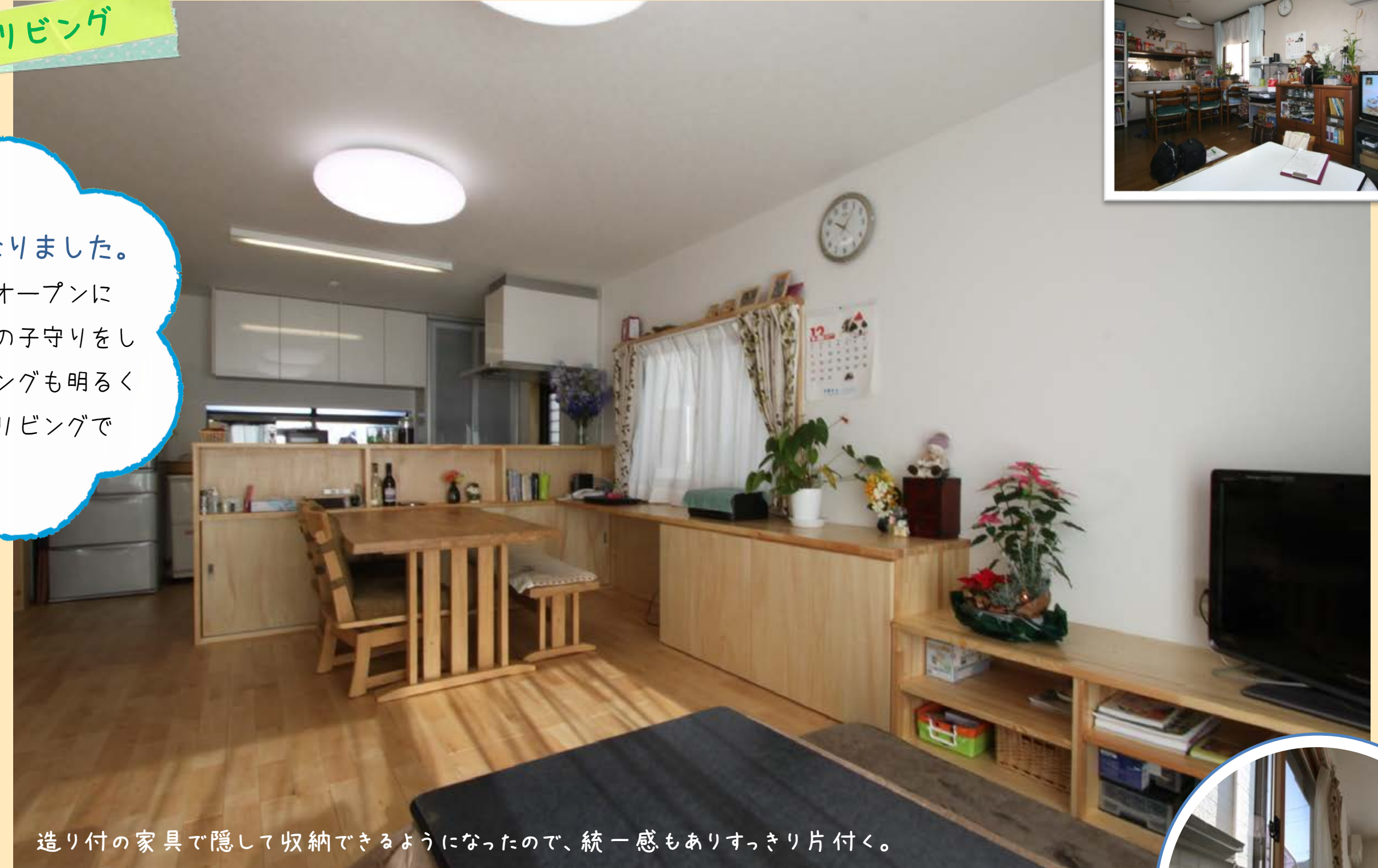
造り付の家具で隠して収納できるようになったので、統一感もありすっきり片付く。