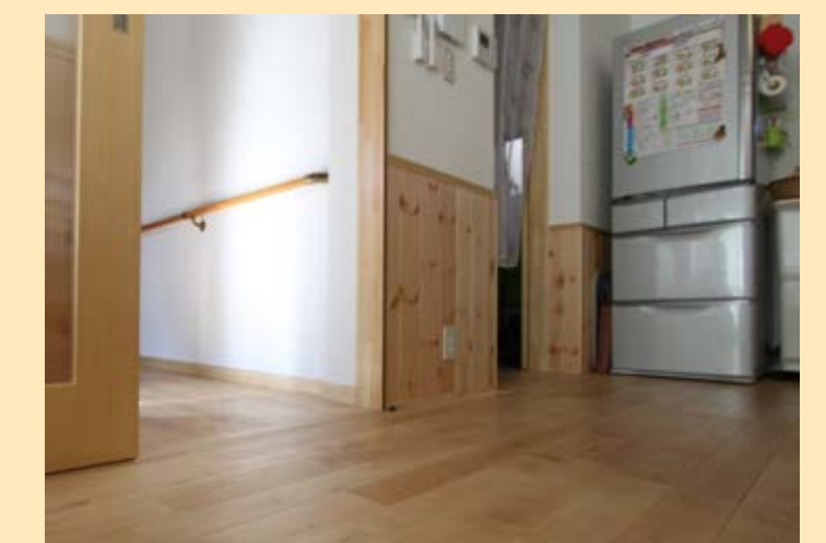
敷居の段差を解消。移動がすく楽になったとおばあさん。