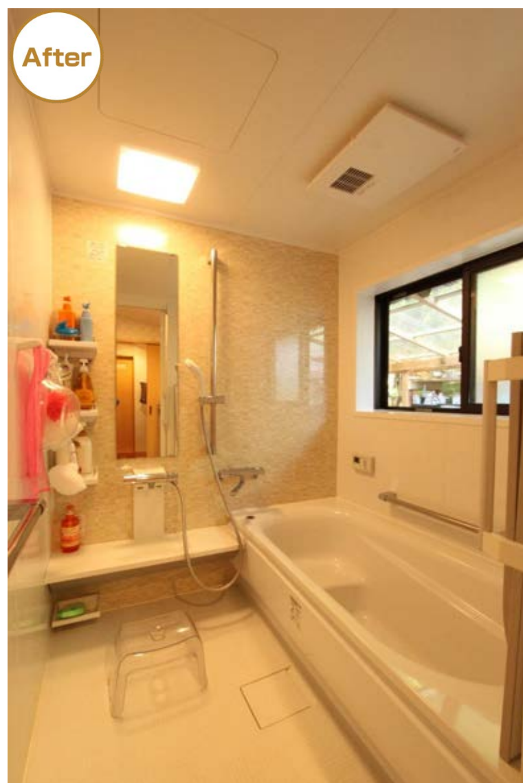
簡単なお手入れでキレイになる浴室は足を伸ばして寛げるとご主人に好評。