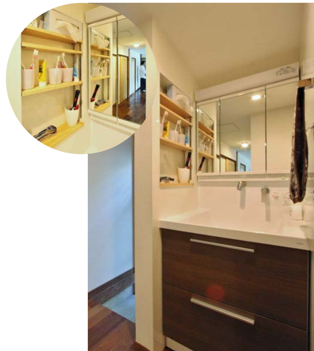
壁の中に可動棚を埋め込み、使う頻度の高い日用品を置けるスペースに。