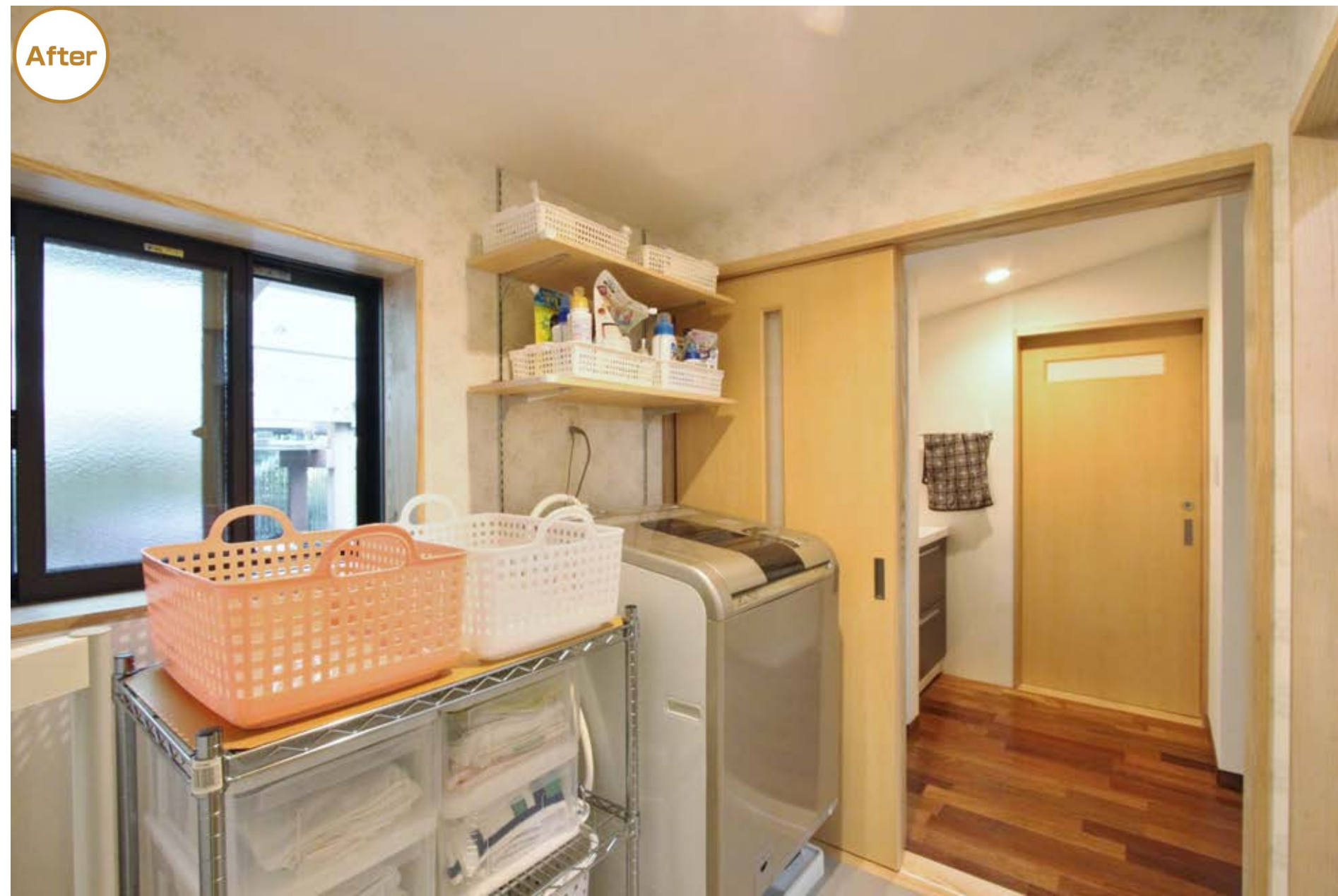
洗濯機上部の収納は、物の大きさによって高さを変えられる可動棚に変更。洗面台の配置やトイレのスペースを見直し、間取りを大きく変えずに使い勝手のよい水まわりに変更。