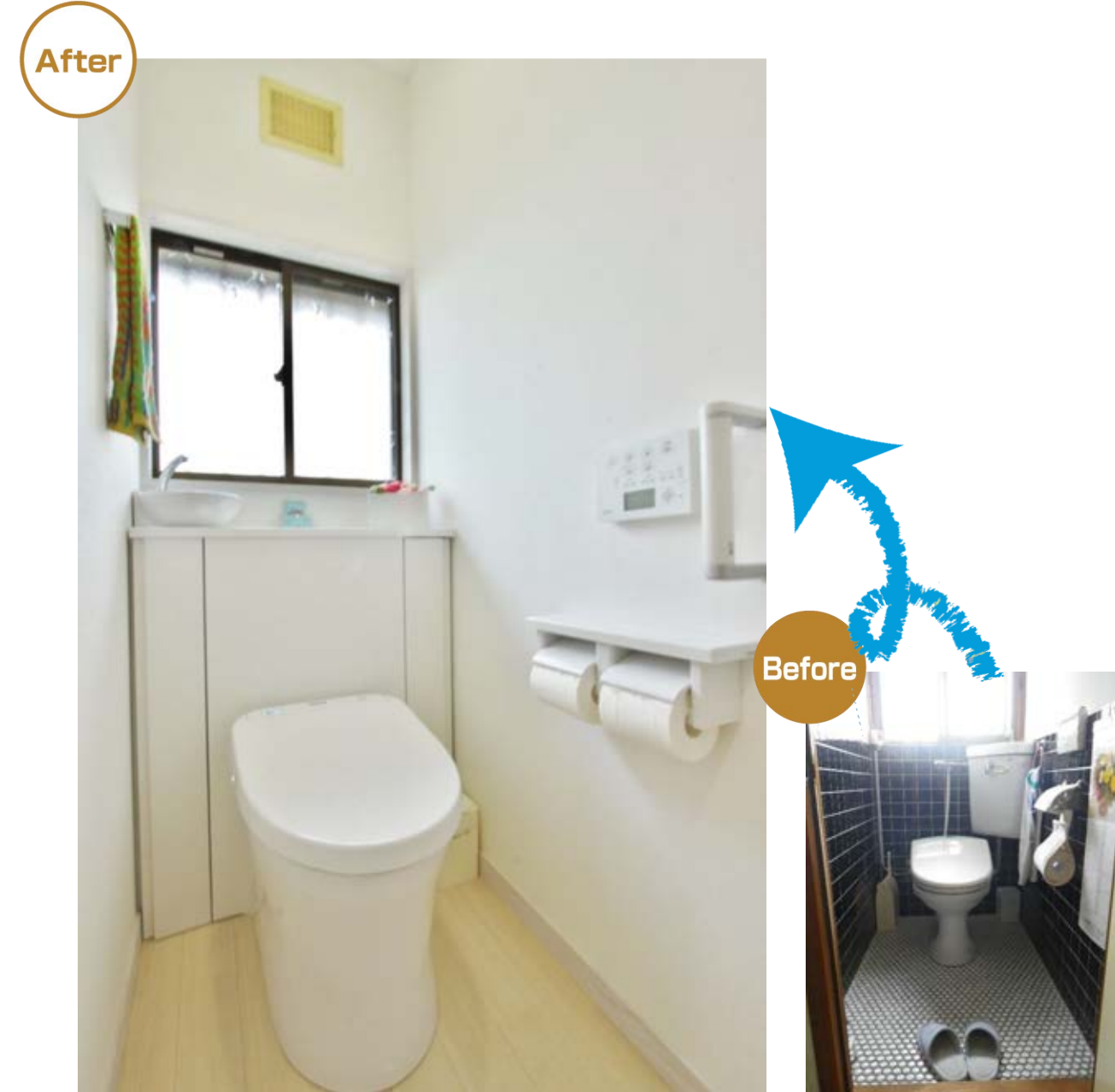
背面タンクの両脇を利用した収納には、人に見せたくないブラシや洗剤などの掃除道具を収納。狭い空間でもデッドスペースを上手く使い、十分な収納を確保しても圧迫感を感じない。