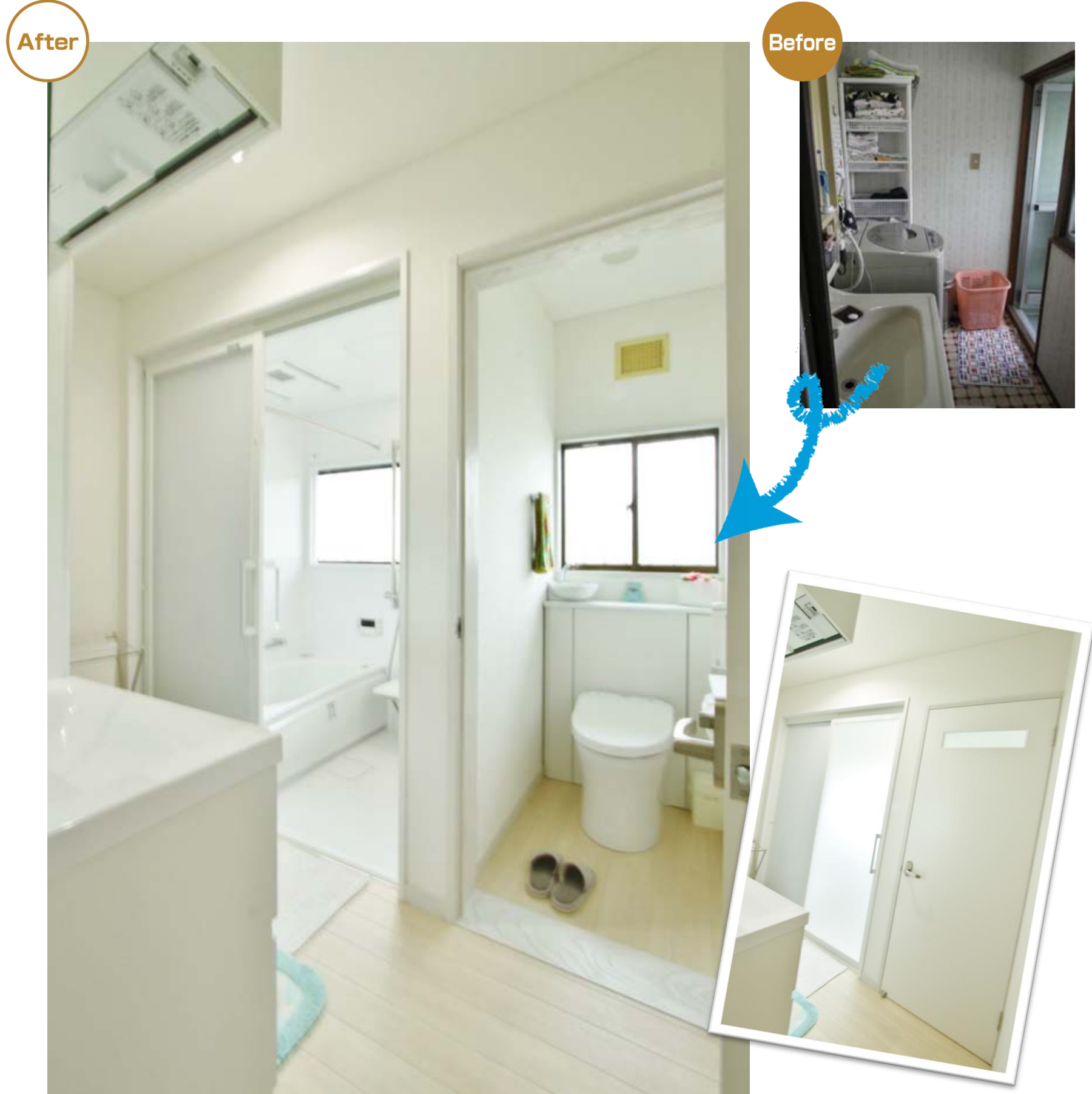
浴室の扉の位置を変更したことで暗かった洗面室にもしっかり光が入って明るい。白色で統一した水まわりは間取りや面積は以前のままで、広くなったように感じる。