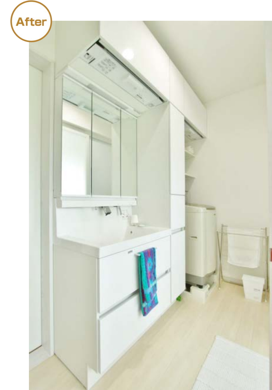
出し入れがしにくい高い場所にある収納も、LIXILの洗面台なら手元まで下りてくるから常用できる収納スペースに早変わり。高さを自由に調節できる棚を洗濯機の上部に設けて、小さな空間も有効活用。