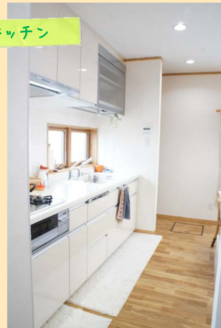
対面式も良いけれど、広く使える壁付けキッチンに！