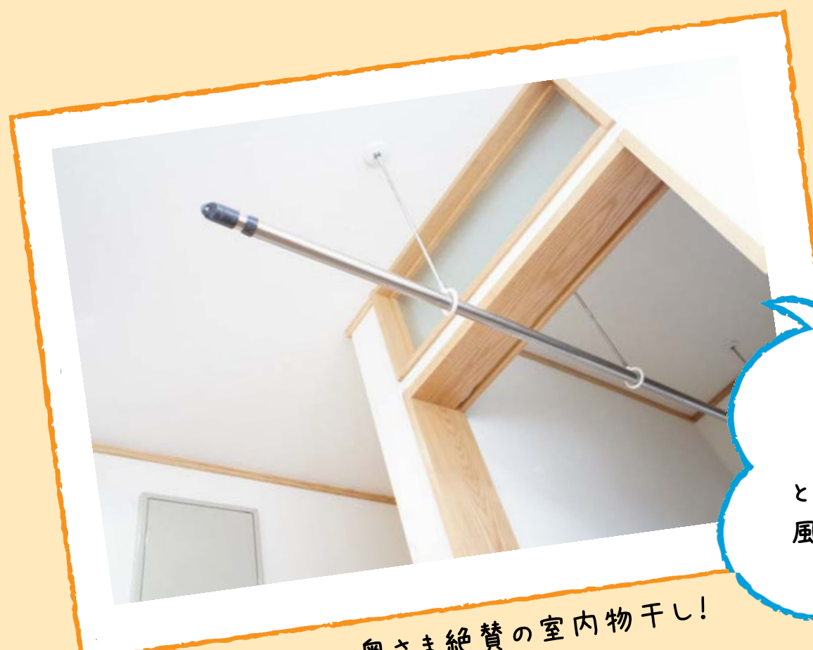
つけて大正解だったと奥さま絶賛の室内物干し!

「夜のうちにここに干しておけば、朝は竿ごと外に移動するだけなんです! これは本当に便利なんですよ～」と奥さま一押し of 納戸にぶら下がる物干し竿。風通しが良いので室内干しでも乾きが早いし、雨の日も大活躍!