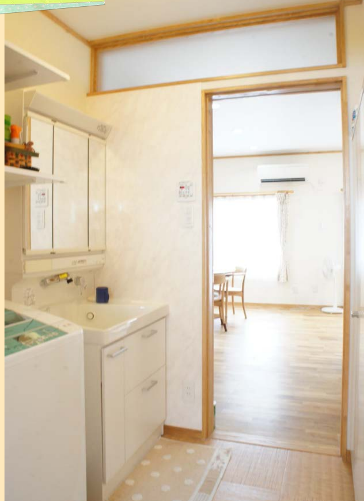
出入り口の上にあるランマのおかげで窓のない洗面脱衣室も明るく快適。