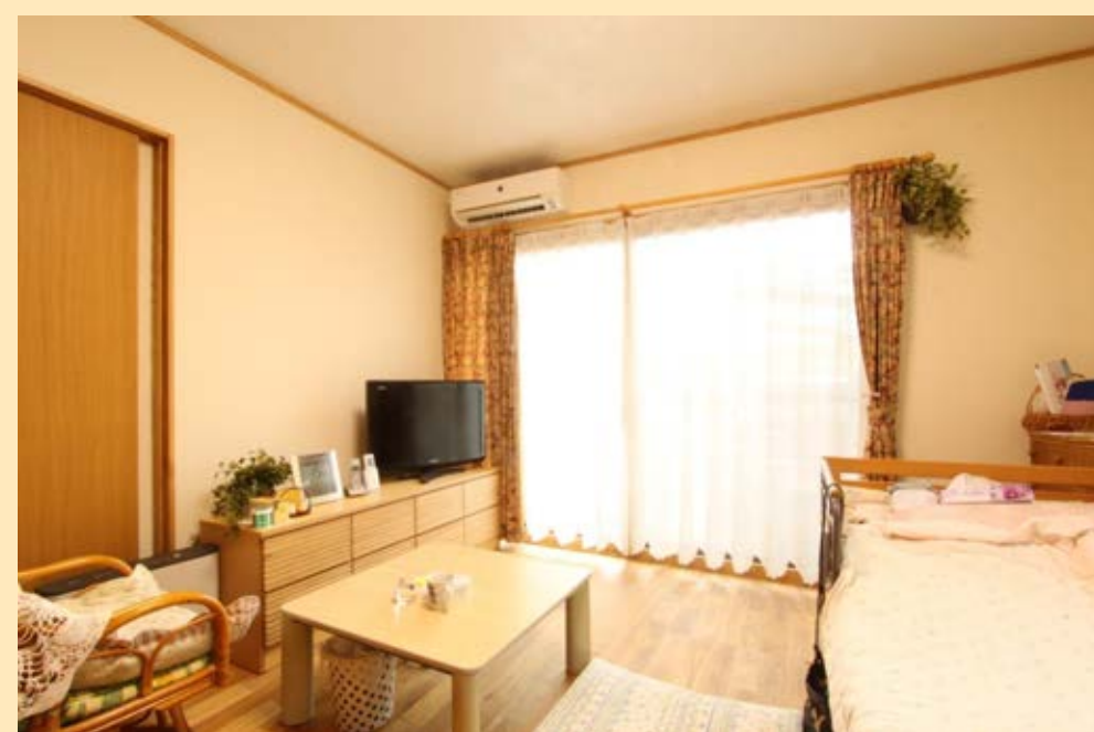
家に一番長くいるおばあさんの部屋は陽当たりが良く気持ちのよい空間。