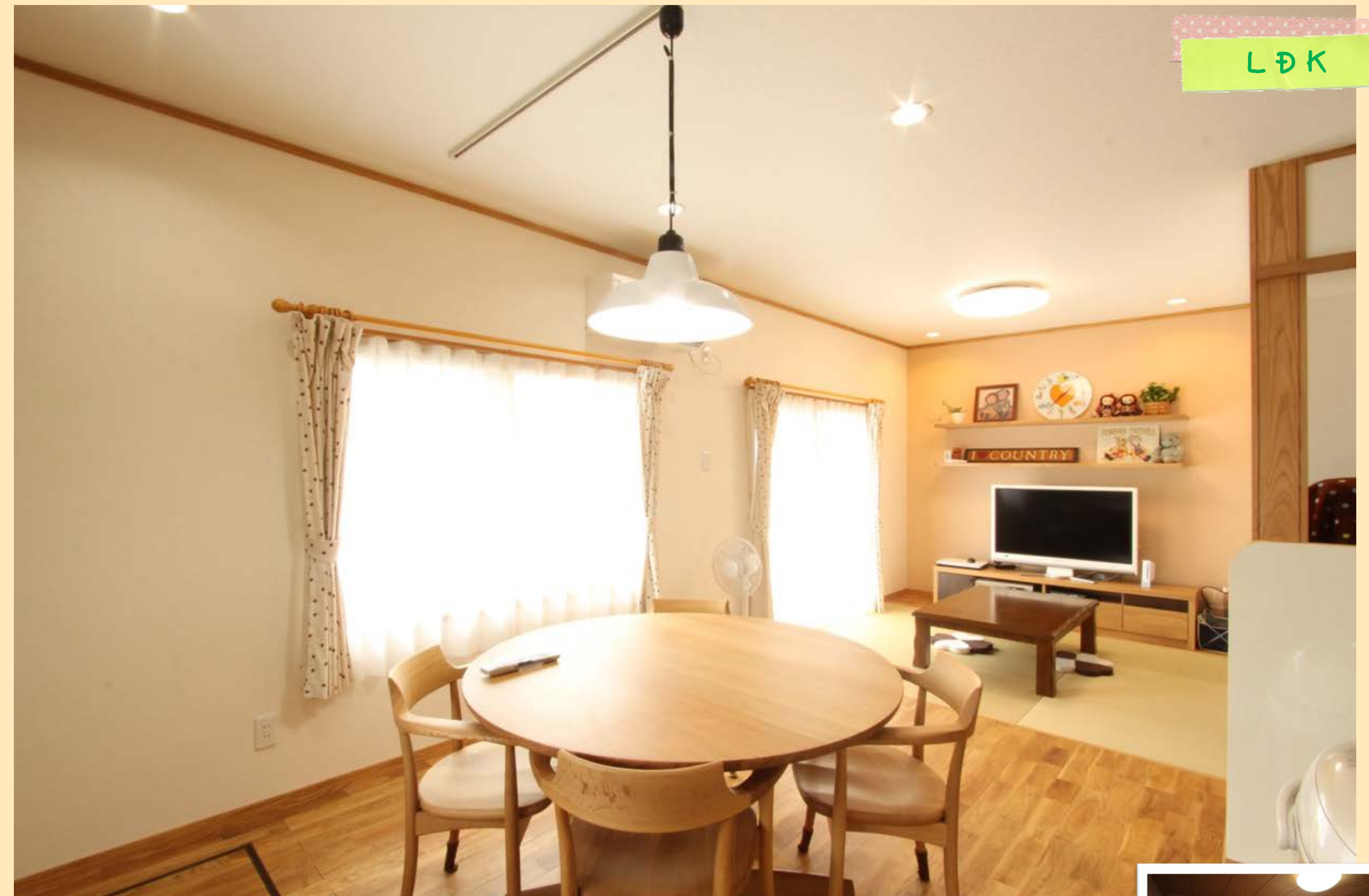
リビングスペースはタタミに。ゴロンと寝ころんだり、足を伸ばしてテレビを見たり……。二重窓の効果で外の音が気にならなくなり、冷暖房効率もアップ。