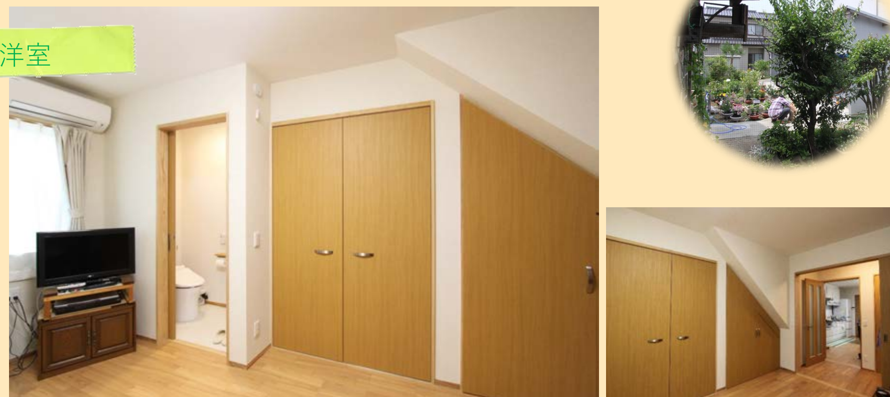
専用トイレもあるおばあさんの部屋。 玄関から直接部屋に行けるし、LDKからも近いのでプライバシーを守りつつコミュニケーションも取りやすい位置に