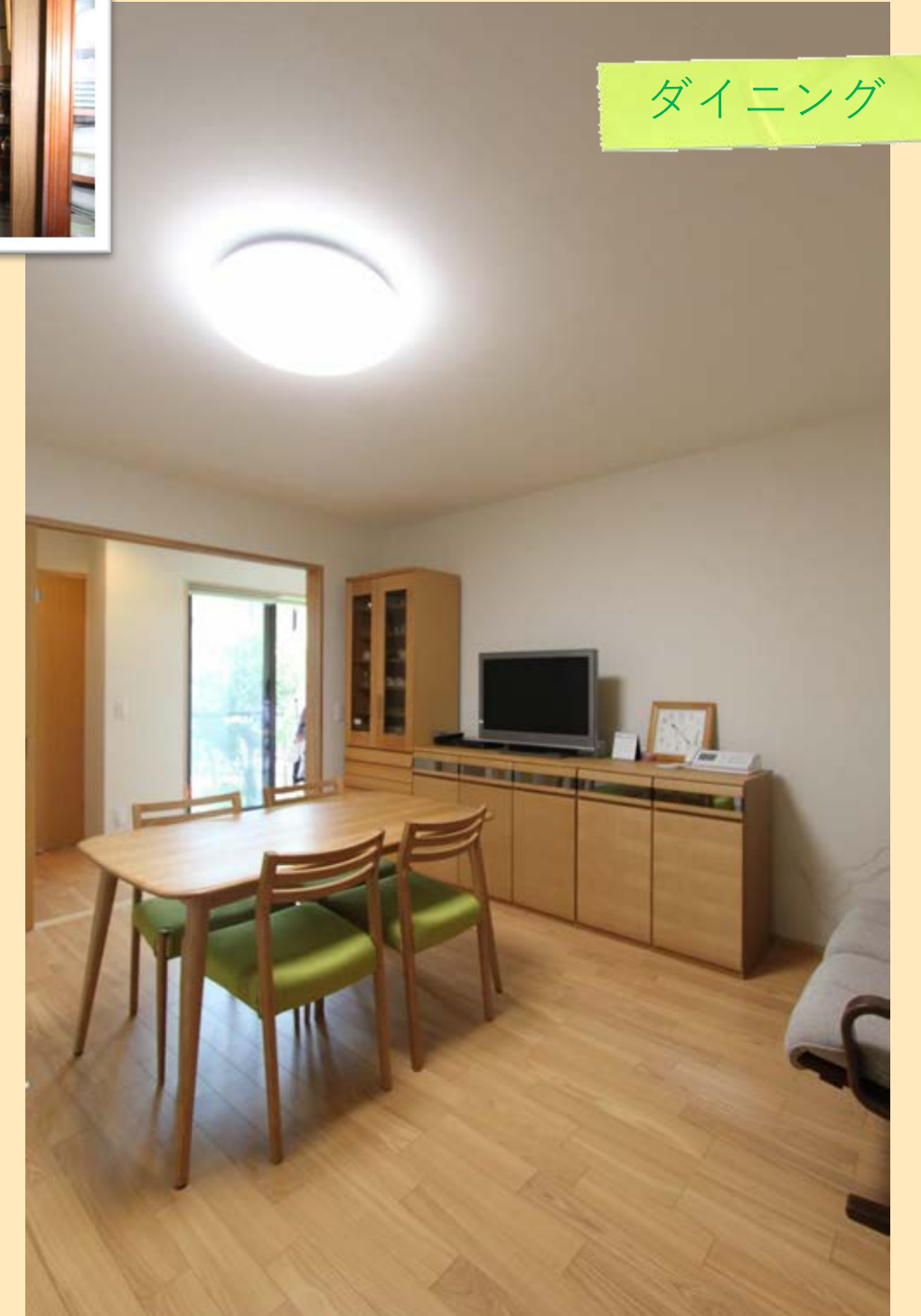
風通しも良くなり家族が集うようになったLDK