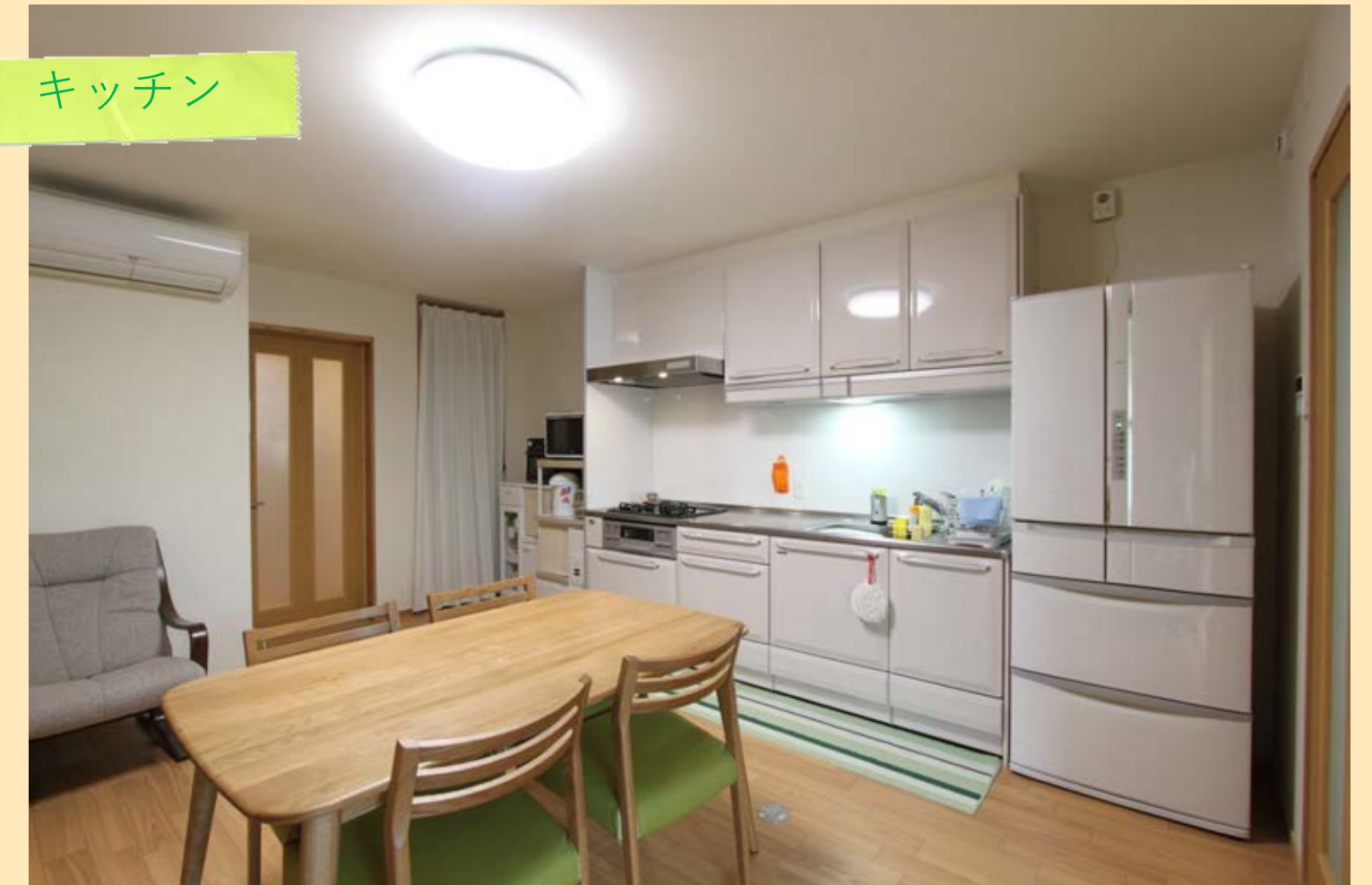
文句のつけようがなく一目で即決したというタカラスタンダードのキッチン