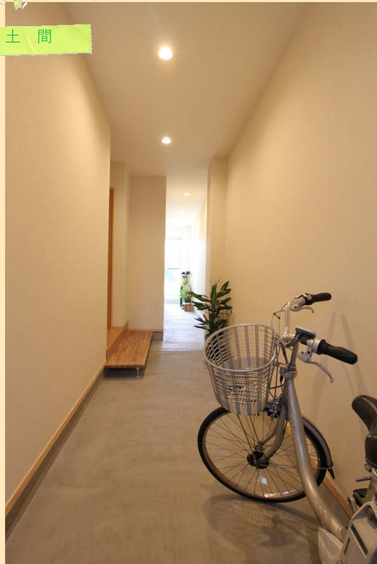
ご夫婦お気に入りのす〜と風が抜ける土間。 家の裏にある庭へここから直接行ける通り庭。