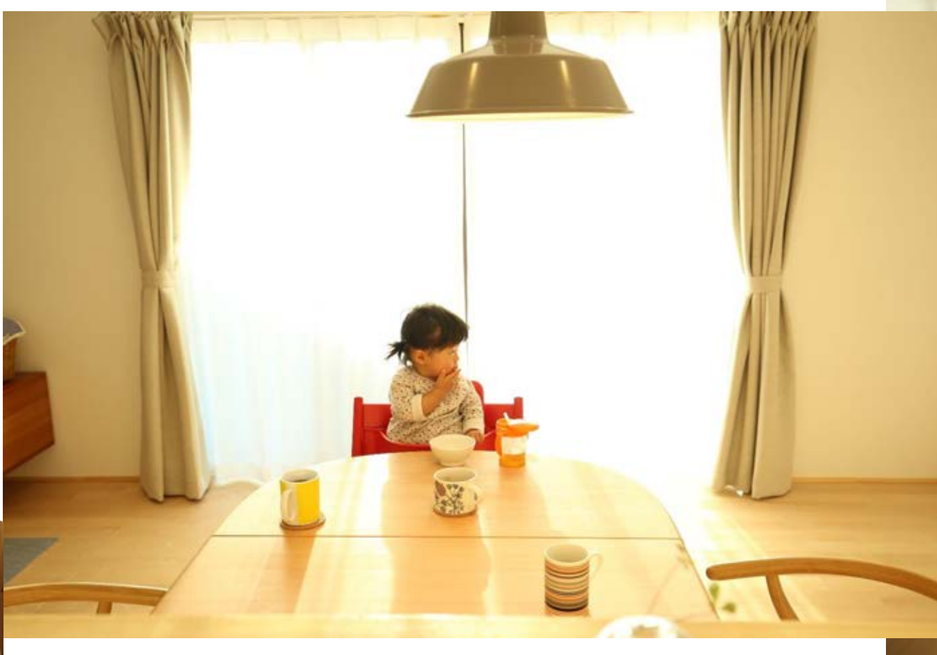
白と優しい色味の木で統一したキッチンまわりは明るく料理や片付けも楽しくなります。壁付けのキッチンから対面キッチンにすることで、リビングで過ごす家族との会話を楽しみながら家事が出来ます。キッチンの奥の食品庫としてもつかえる大容量のリビング収納は使い勝手◎。

設計・施工のポイント 細かく分かれていた部屋をつなげて家族みんなが寛げるLDKが完成しました。すっきり暮らしたい、と話されるW様のために、キッチンカウンターには収納棚を造り付けました。また大容量のリビング収納には入り口を2つ設け、キッチン側からは食品庫として食品やストック品を、リビング側からはストロープ等の季節物等を収納できるように設計しました。