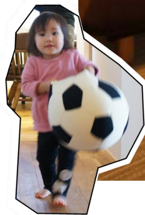
以前より広がったのにあたたかいLDK。