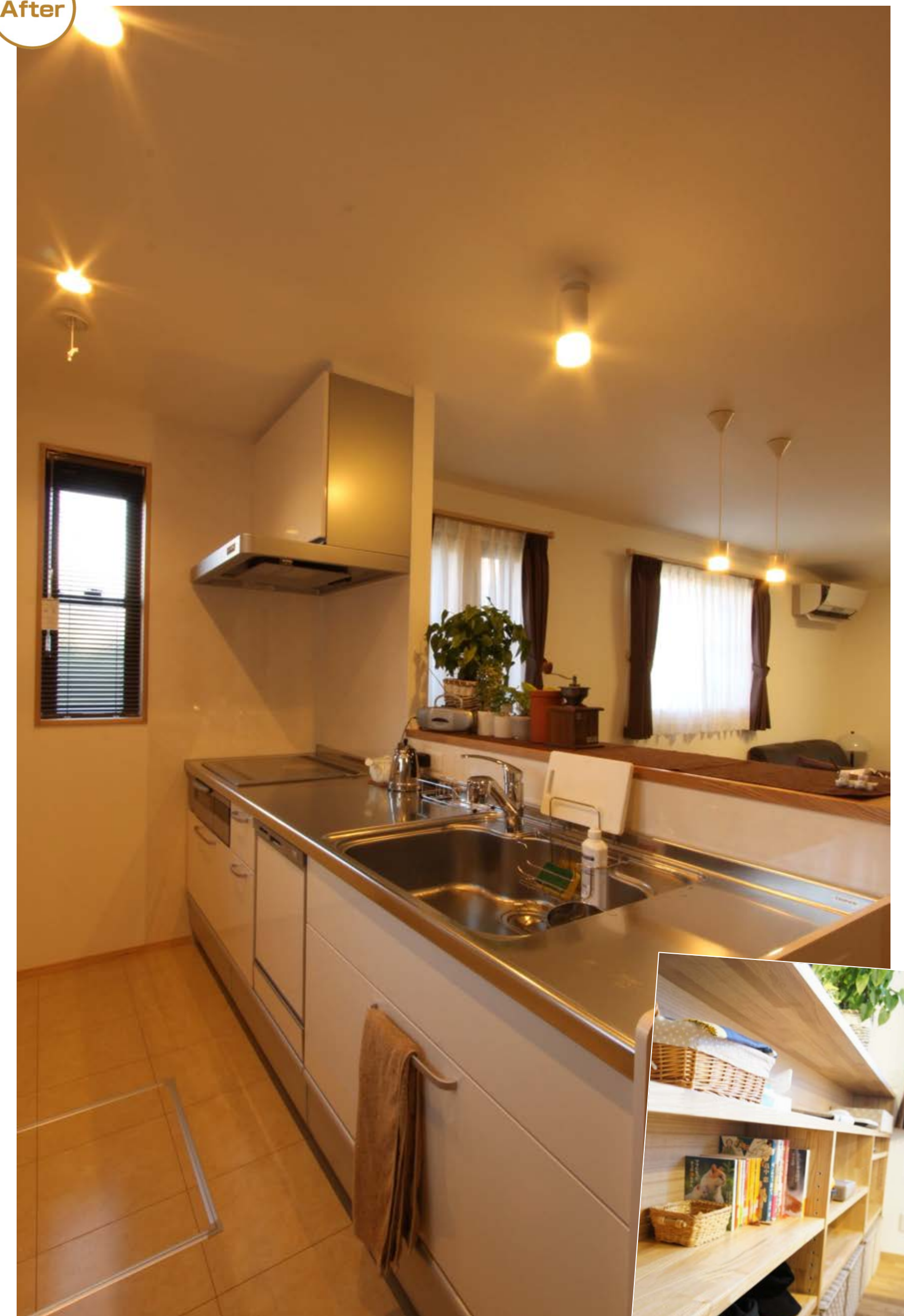
キッチンカウンターはオープンな収納。何がどこにあるか分かるし、すぐにさっと取り出せる。