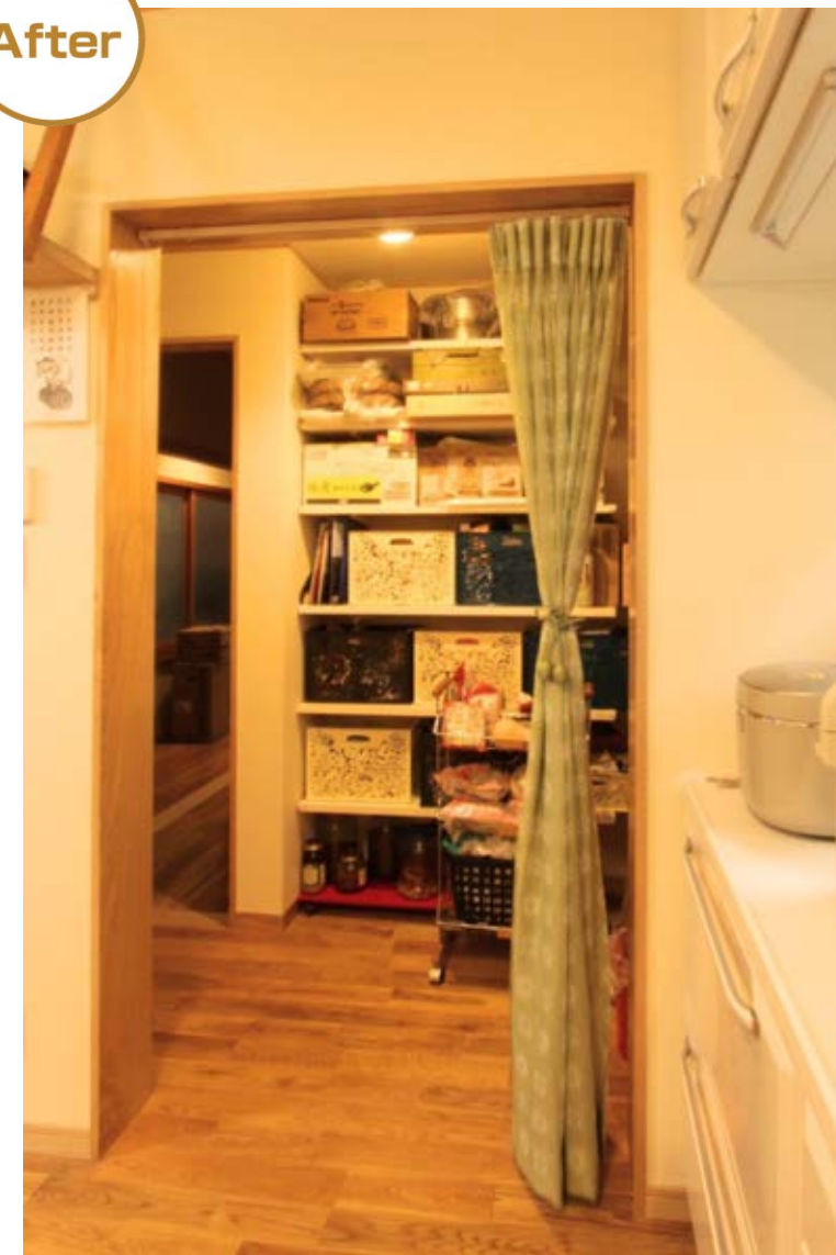
キッチン脇にある食品庫(パントリー)は天井から床まで一面収納できる。通路としても使えるから便利。