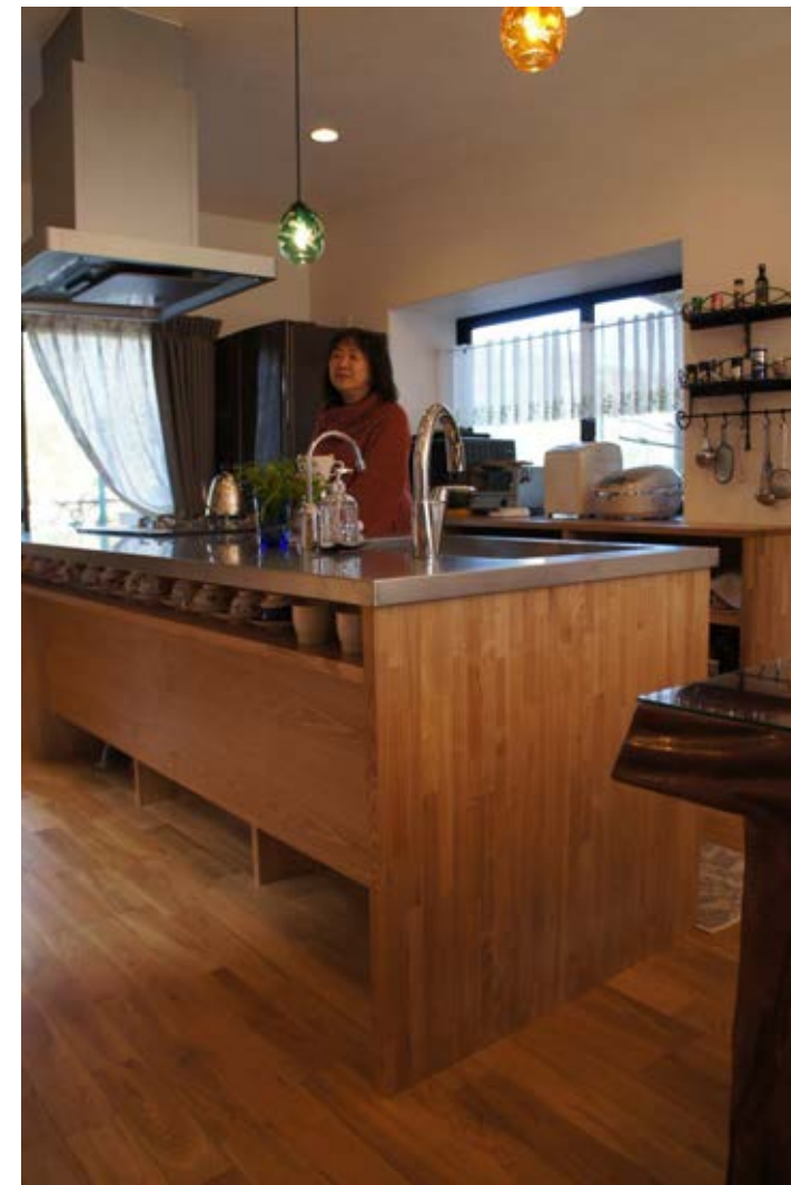
お友達を招くのが大好きというご夫婦。ご夫婦はもちろん、遊びに来るお友達ものんびりゆったりできるようなキッチンに。