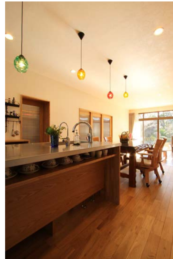
キッチンカウンター裏にはコレクションのティーカップが並ぶ。アクセントになっているカラフルな照明は奥様のお気に入り。