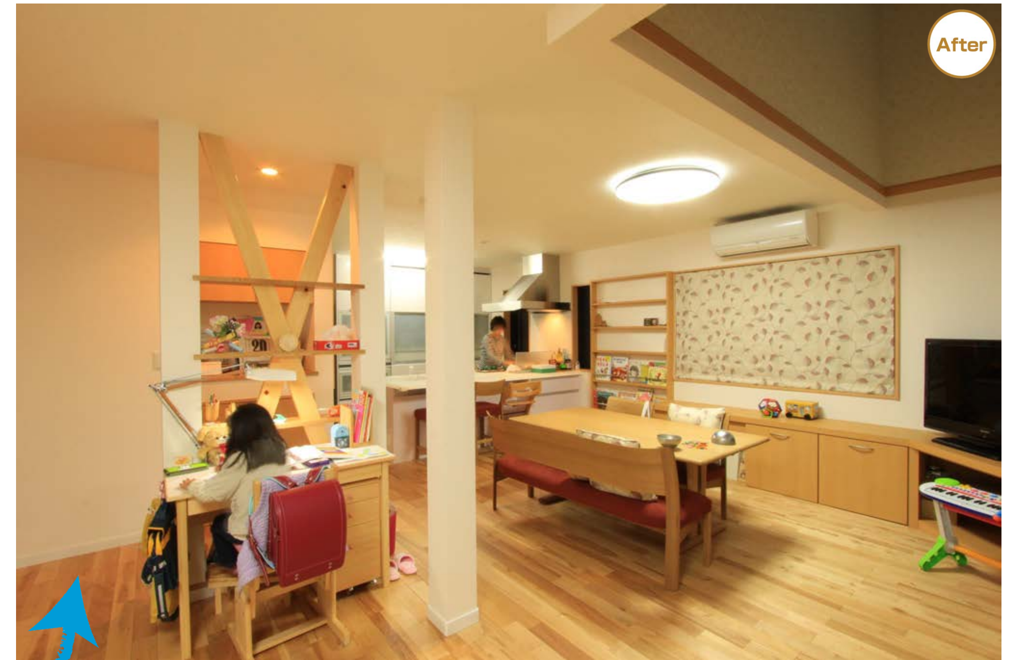
After 既設の和室部分も取り込んで広くなったLDK。 パントリーや造り付け収納を設置したので、LDKがスッキリと片付くようになりました。