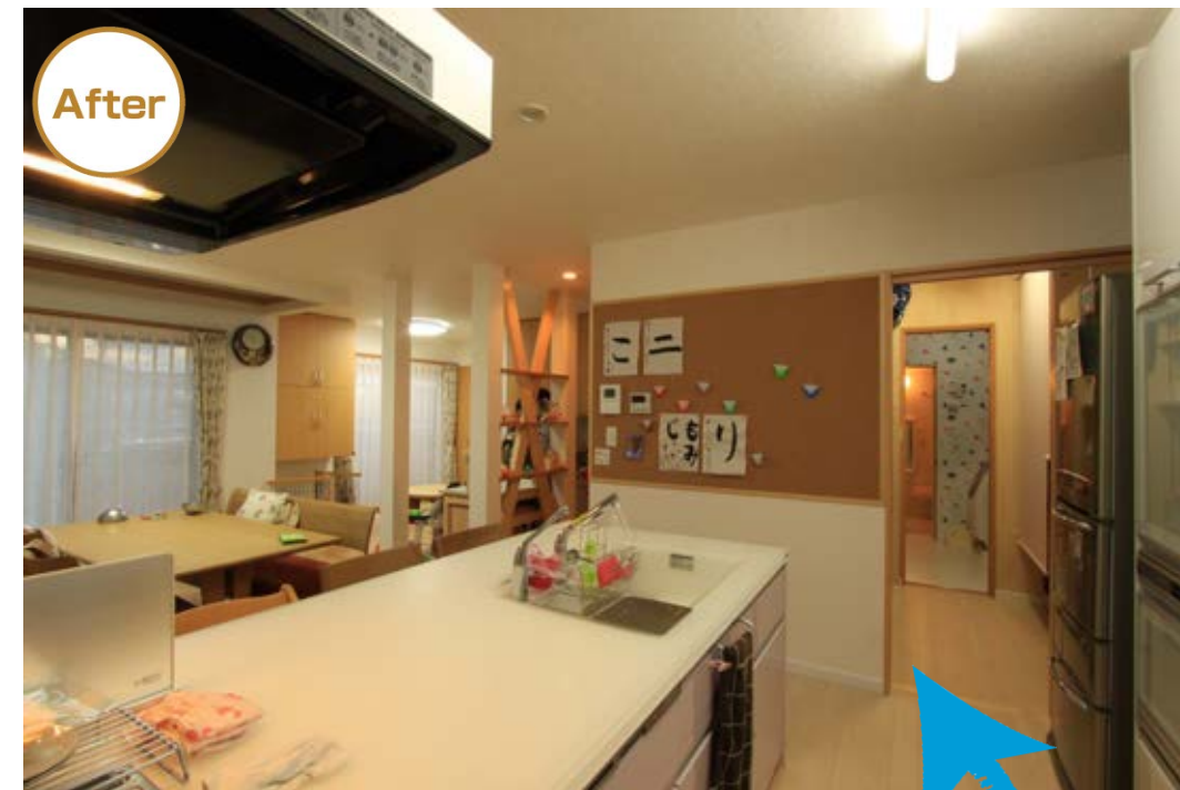
After キッチン→パントリー→洗面脱衣室とつづく。 キッチンからは全てが見渡せるのがうれしい。