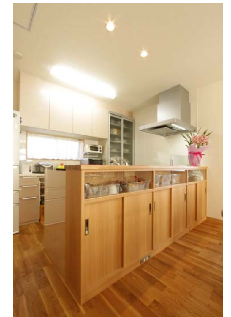
キッチンカウンター裏は全面収納。ご主人でも何がどこにあるか分かりやすいように上部分だけガラス戸に