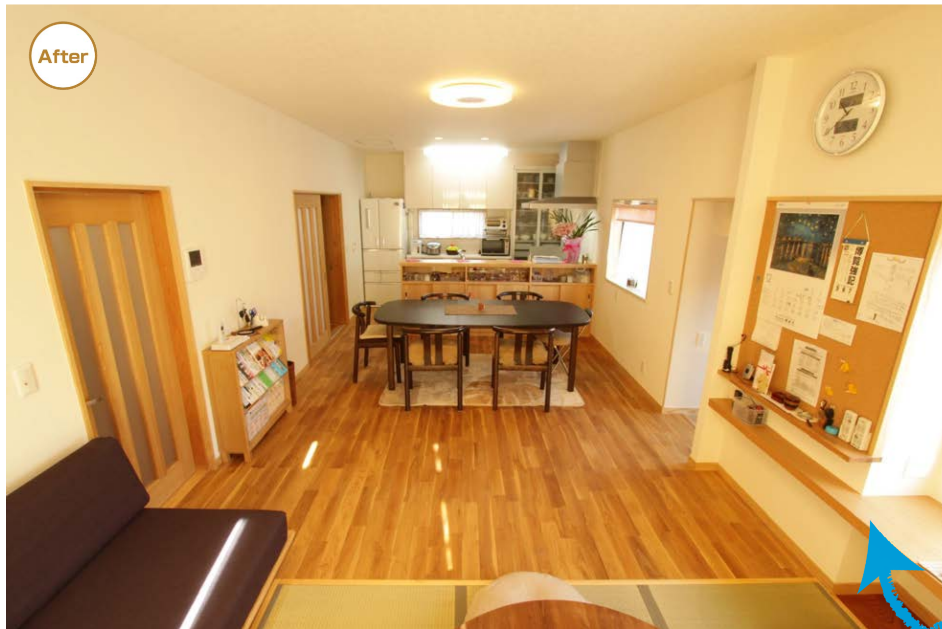
キッチンの吊り戸棚や和室との間の垂れ壁などがなくなり開放感もあり、明るくなりました。