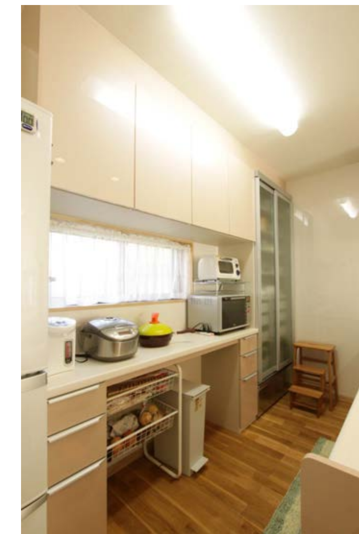
背の高い奥さまに合わせて使い勝手の良い高さに合せました。コンロを使っているのを忘れないように、リビングからも見えるオープンな対面キッチンにしました。