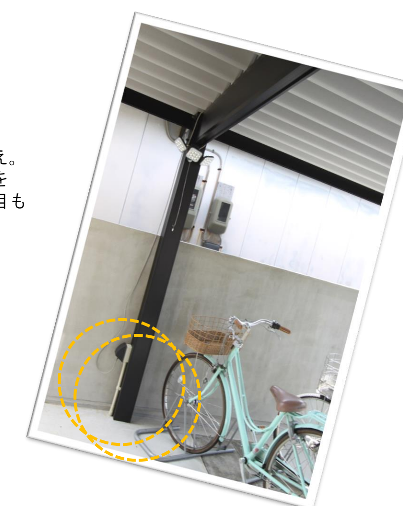
外部コンセントは、掃除機や水圧をかけるホースを繋いで車の掃除に大活躍！照明を点ければ、防犯にも◎