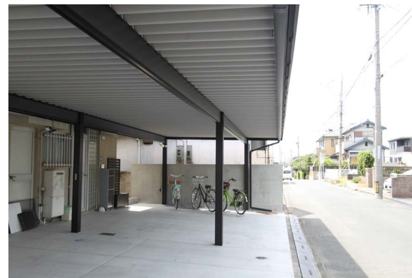
耐食性に優れたガルバニウム鋼板の屋根材に断熱材をプラスして、錆びにくく断熱性にも強いカーポートに