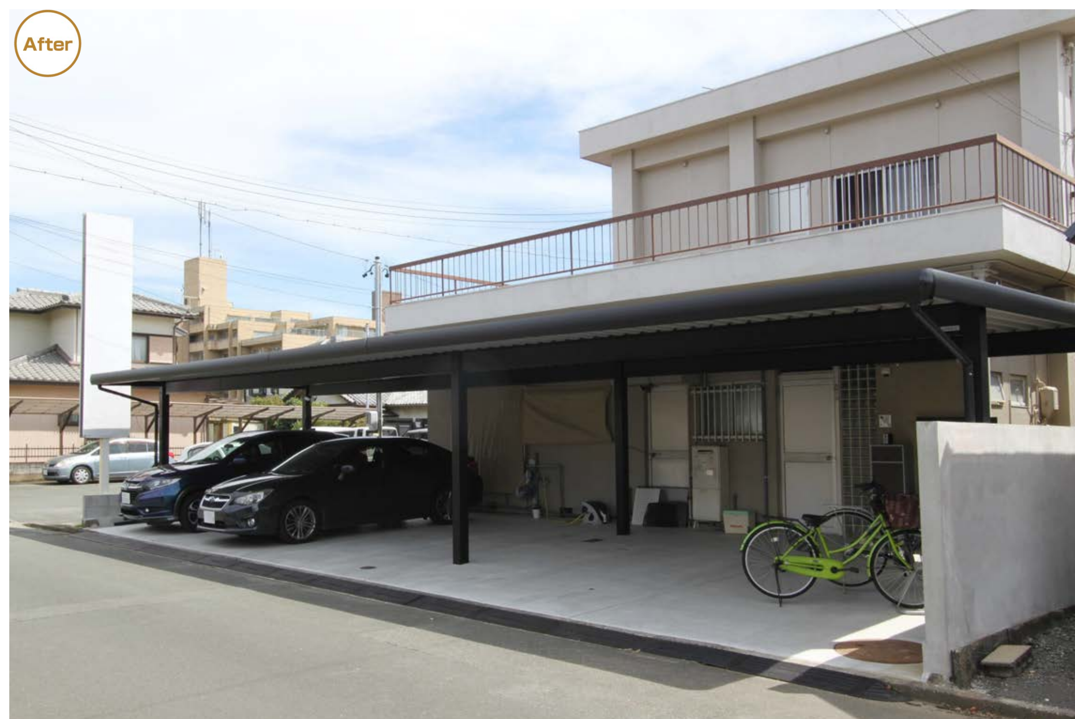
間口14mのオーダーサイズのカーポート。駐輪スペースも含めると最大5台も駐車できます！