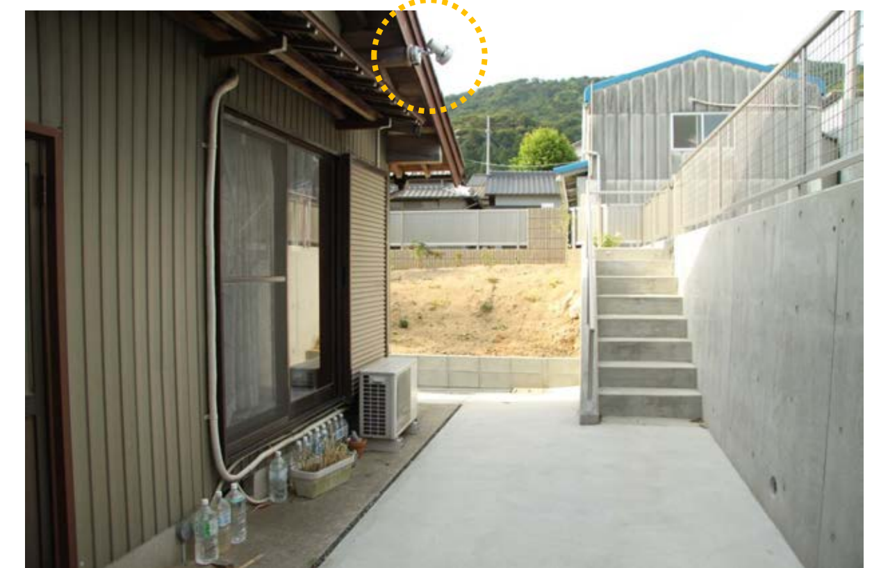
駐車場と家までを最短距離で繋ぐ階段。建物側にセンサーライトを付けて、夜でも安全に通れる