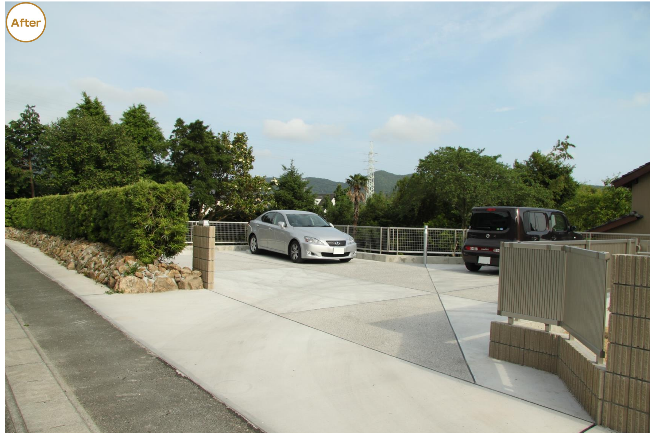
植栽を無くして、お手入れしやすいフェンスに変更。裏の敷地に来客や子ども達が止められる広さの駐車場も合わせて新設。